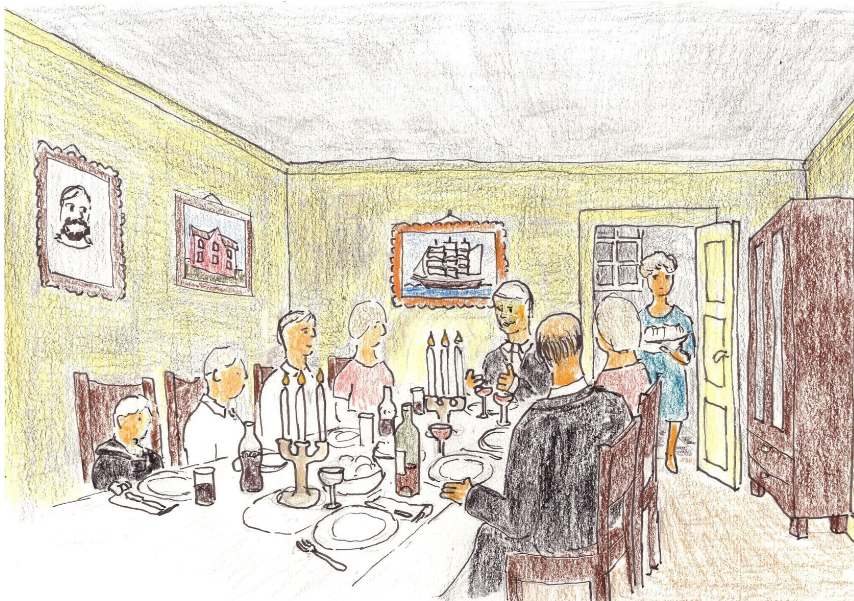
Vi fikk masse god mat, men måtte sitte veldig lenge til bords.